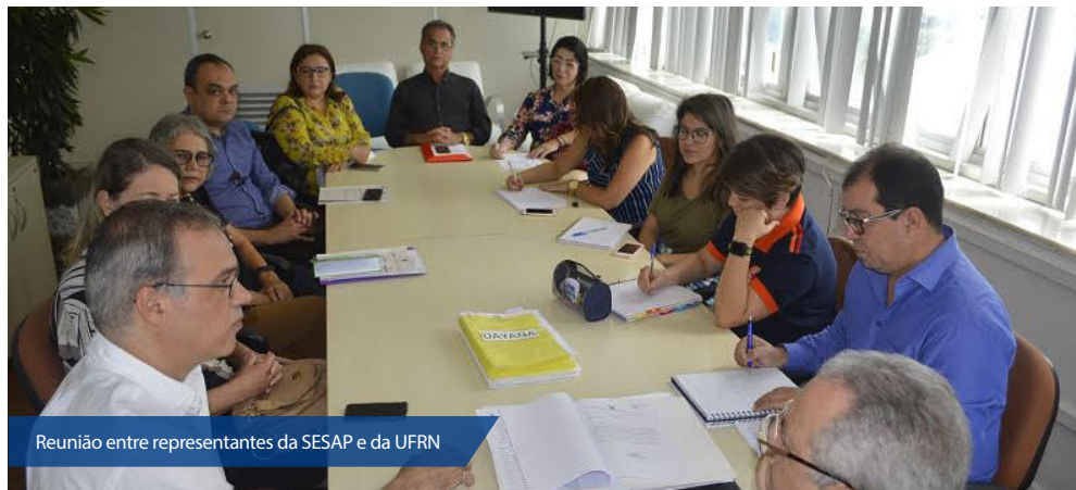
Reunião entre representantes da SESAP e da UFRN

A nova unidade do Instituto de Medicina Tropical (IMT) está instalada em um prédio de quatro mil metros quadrados e realizará pesquisa clínica sobre doenças infecciosas e infecto-contagiosas, doenças tropicais e as emergentes, como Leishmaniose, HIV, Tuberculose e Hanseníase, além de atuar na produ-