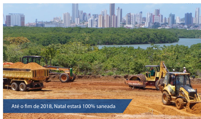
Até o fim de 2018, Natal estará 100% saneada

Para muitas pessoas os benefícios parecem invisíveis, enterrados como a própria tubulação do esgoto, mas nas matérias desta série descobriremos os reflexos